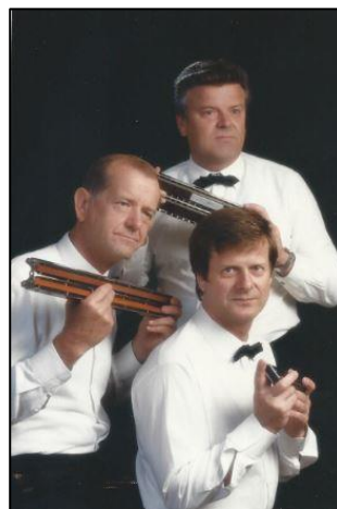
Trio Piccolo 1988